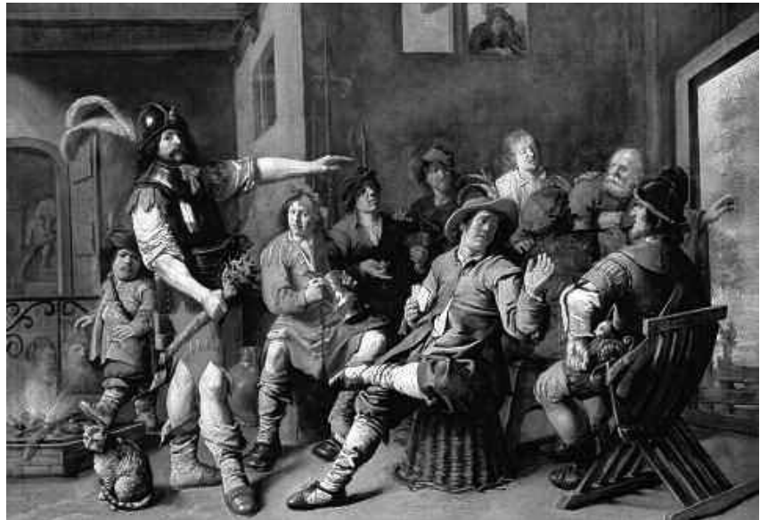
Jan Miense Molenaer: Péter tagadása (1633)

• Krisztus szerelme az ő kegyelméből van, nem emberi erőfeszítés eredménye. Jézus nem várja el Pétertől, hogy kemény munkával hozza helyre azt, amit tagadásával elrontott. Isten kegyelme meg nem érdemelt ajándék. Nem lehet jó cselekedetekkel megszerezni. Az egyetlen lehetséges válasz a kegye-